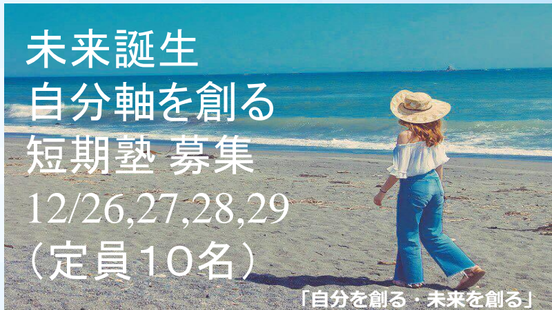
「自分を創る・未来を創る」

未来誕生 自分軸を創る 短期塾 募集 12/26,27,28,29 (定員10名)